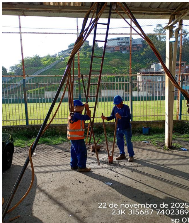
Figura 01 – Execução de sondagem;