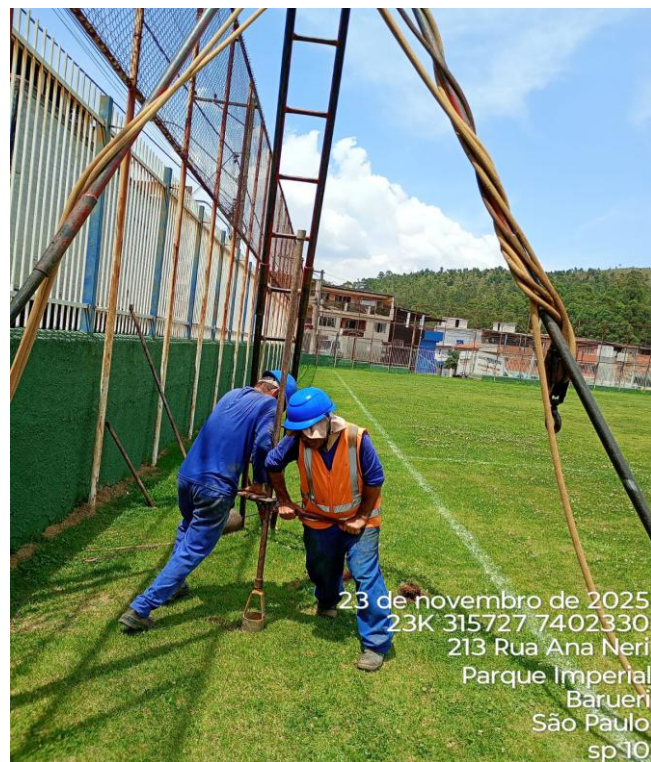
Figura 10 – Execução de sondagem;