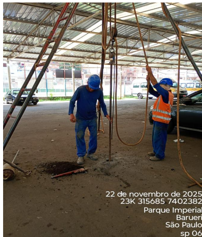
Figura 06 – Execução de sondagem;