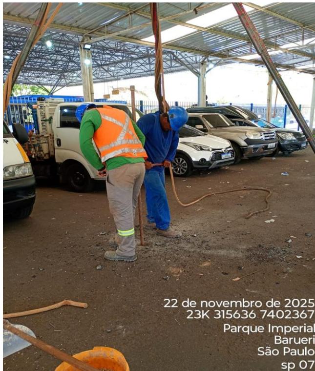
Figura 07 – Execução de sondagem;