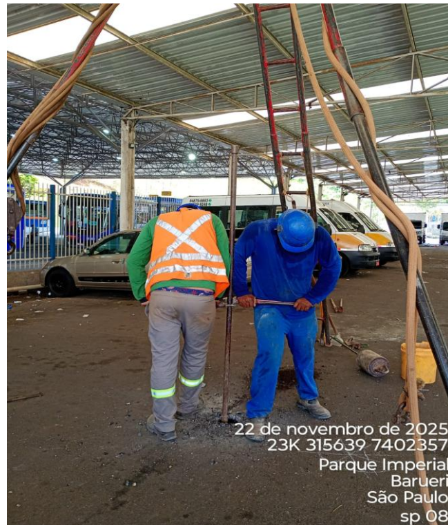
Figura 08 – Execução de sondagem;