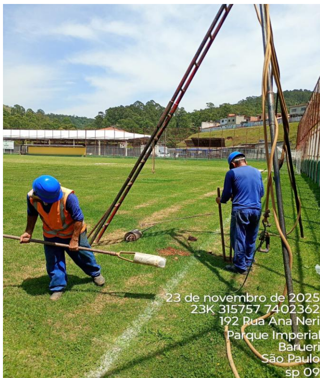
Figura 09 – Execução de sondagem;