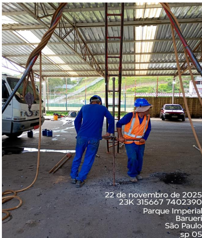
Figura 05 – Execução de sondagem;