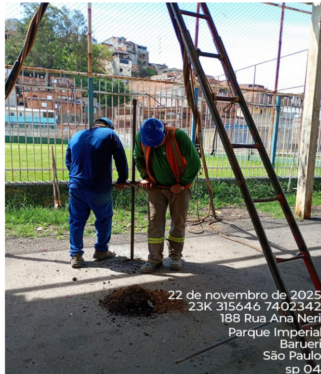
Figura 04 – Execução de sondagem;