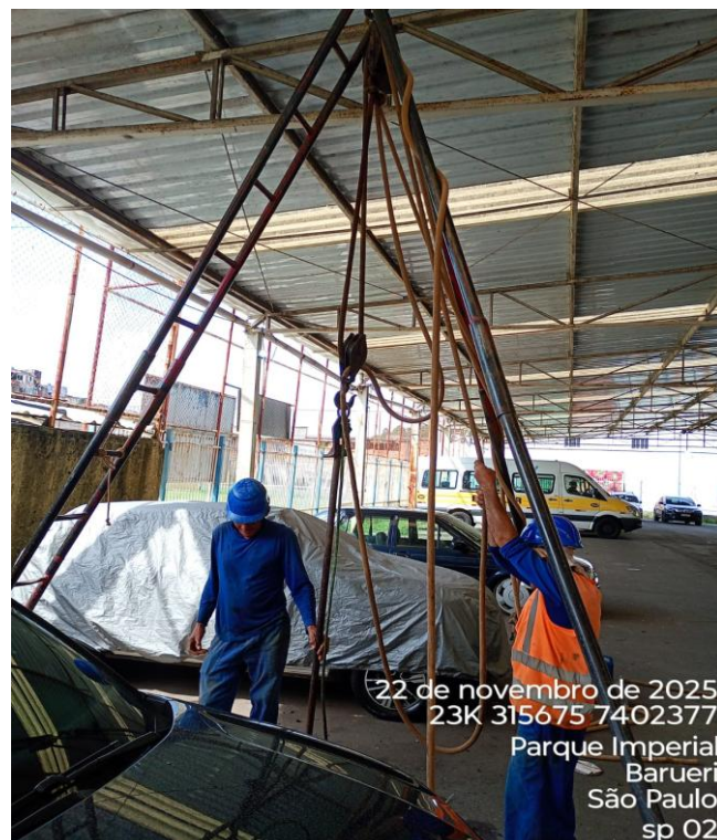
Figura 02 – Execução de sondagem;