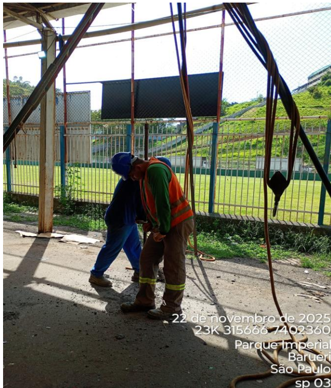
Figura 03 – Execução de sondagem;